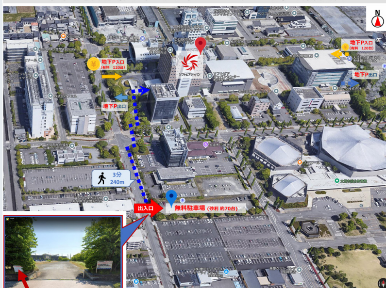
駐車場と会場（ソフトピアジャパン センタービル）の案内地図

※駐車場は地下駐車場または、臨時駐車場をご利用ください。 臨時駐車場は、他のイベントと共同利用ですので、満車の場合 はご容赦ください。